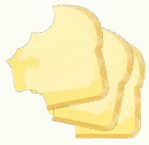
Céréales, grains, pains, pâtes, farine et sucre