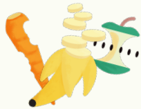
Fruits ou légumes cuisinés ou non