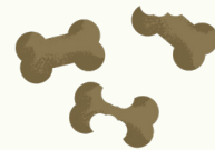
Nourriture pour animaux domestiques